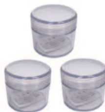
No.3000-J 輝楽ミニ用研磨槽 × 3個