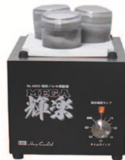
メガミニボード使用例